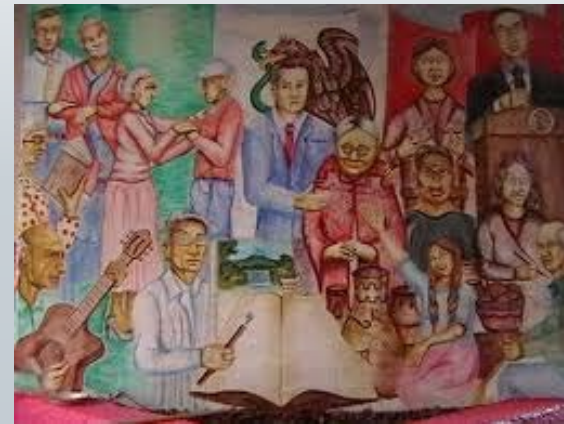
Alegoría al adulto mayor. Berosa 68 Mural al fresco. Casa del Adulto Mayor.

Corresponde al momento actual garantizar las condiciones para que dicho incremento sea efectivamente una ganancia, en términos de una vida con calidad y dignidad.